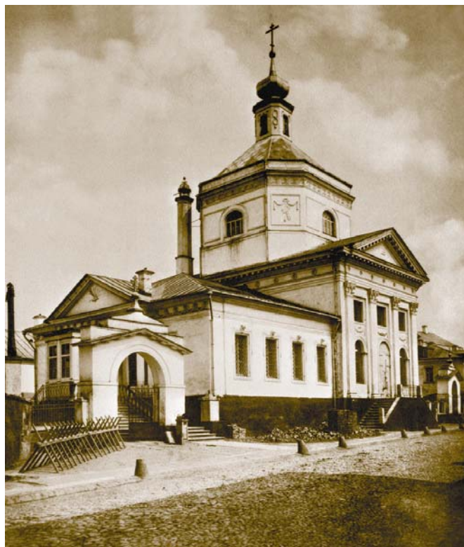
Церковь Троицы в Серебряническом переулке, рядом с которой стоит дом Ананьиных. Церковь и дом (сильно перестроенный) сохранились до наших дней

Уцелевшие до наших дней дома Ананьиных – матери и братьев Анны Ивановны Зиминой – находятся по адресу: Серебрянический переулок, дом 2 и дом 8, другим фасадом они выходят на Яузскую улицу ( старые номера 418/377, 378; 415/374 ).