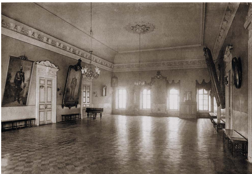
Актный зал Московского Императорского коммерческого училища на Остоженке. Фото конца XIX века