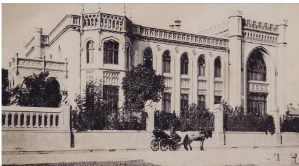
Дом Морозовых на Спиридоновке. Вид со стороны улицы. Фото 1902 года

В последней четверти XIX века московские купцы набрали силу. Представители молодого поколения получали прекрасное образование, имели широкий культурный горизонт, ежегодно посещали Европу и были в курсе тамошних веяний в стиле жизни. В прошлое уходили типы Островского, его «темное царство», пропитанное, по словам одного из публицистов, «самодурством, невежеством, дикостью и подловатостью» 1 . За 20–30 лет произошла культурная трансформация предпринимателей. Блестящий знаток купеческой жизни первопрестольной (при этом дворянин по происхождению) П.Д. Боборыкин написал в 1880-х годах об этом так: «До шестидесятых годов нашего века читающая, мыслящая и художественно-творящая Москва была исключительно господская, барская... В последние двадцать лет, с начала шестидесятых годов, бытовой мир Замоскворечья и Рогожской тронулся: детей стали учить; молодые купцы попадали не только в коммерческую академию, но и в университет, дочери заговорили по-английски и заиграли ноктюрны Шопена. Тяжелые, тупые самодуры переродились в дельцов, осознававших свою материальную силу уже на другой манер» 2 .