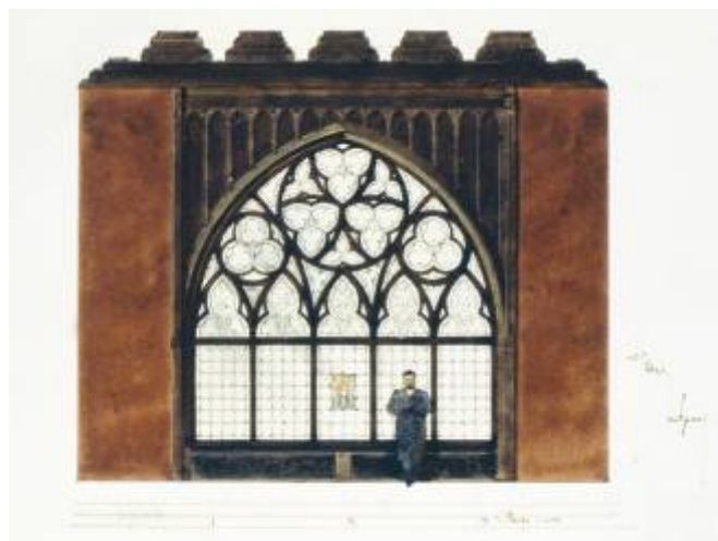
Особняк З.Г. Морозовой на Спиридоновке. Готический витраж. Эскиз Ф. Шехтеля. 1893 год

После гибели Саввы в Каннах в мае 1905 года (он был найден с пулевым ранением в гостиничном номере, и среди историков до сих пор идут споры – было ли это самоубийством или убийством) Зинаида Григорьевна прожила в доме на Спиридоновке до 1909 года. А затем без сожаления продала его предпринимателю и банкиру Михаилу Рябушинскому. В 1929 году владение было передано Наркомату иностранных дел. Сейчас в нем находится Дом приемов Министерства иностранных дел России.