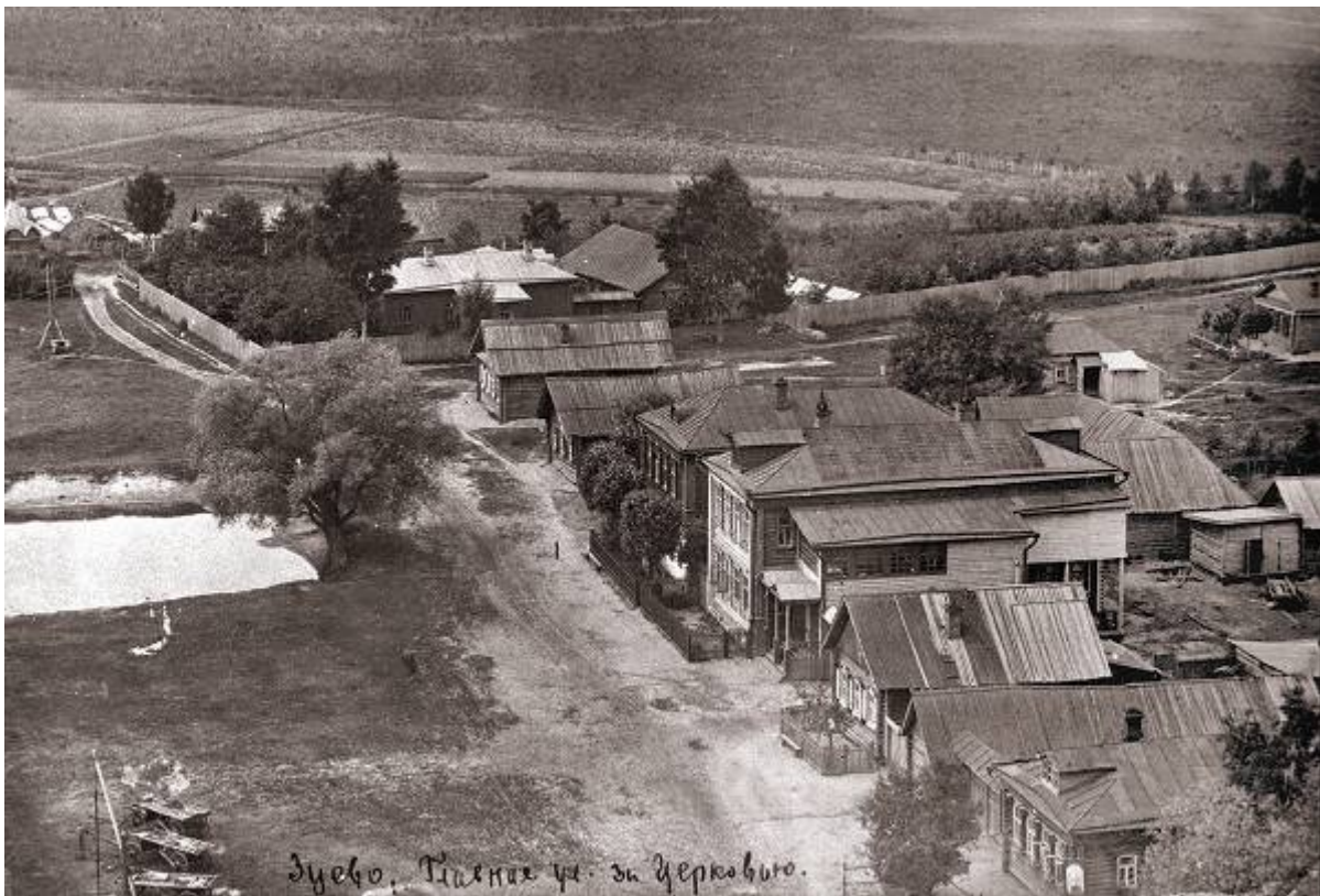
Село Зуево. Главная улица за церковью. Фото конца XIX века