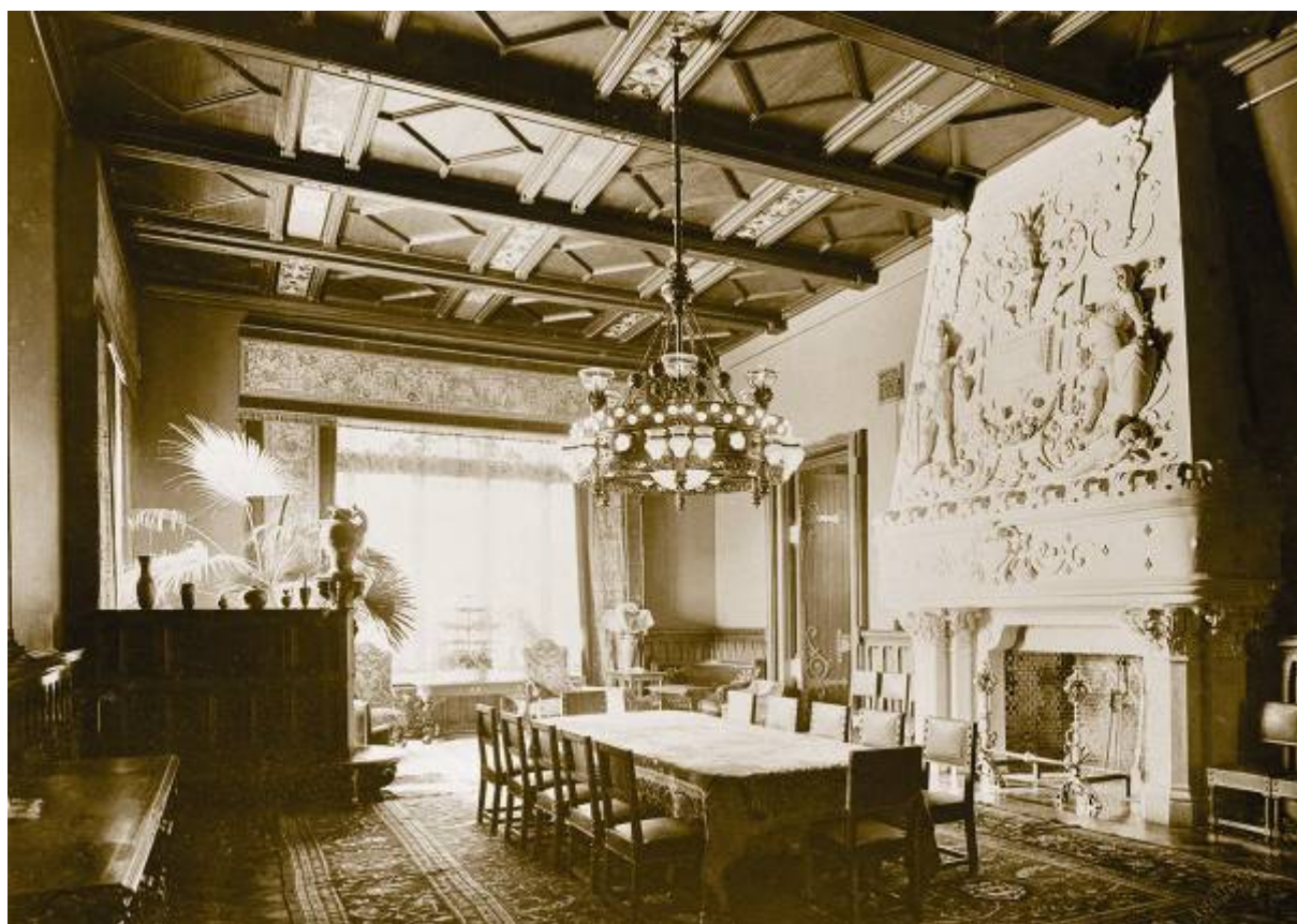
Каминный зал в доме З.Г. Морозовой на Спиридоновке

Проект усадьбы был заказан молодому архитектору Францу (Федору) Осиповичу Шехтелю, который за год до этого построил Морозовым деревянную дачу в Киржаче. К июлю 1893 года архитектор представил заказчикам три варианта главного дома – в стилях французского ренессанса и рококо, и в стиле английской неоготики. Предпочтение было отдано последнему варианту и не случайно: к 1890-м годам связь торгово-промышленного дома Морозовых с ткацкой индустрией Манчестера насчитывала несколько десятилетий. Савва Морозов учился в Кембридже, бывал в Манчестере, видел неоготические дворцы тамошних текстильных магнатов. Его смело можно причислить к кругу московских англоманов: с детства он знал английский язык, которому научился у гувернера-англичанина. В 1887 году прожил в Англии некоторое время, изучая новые технологии крашения тканей. А когда вернулся в Москву, увлекся чтением романов Вальтера Скотта в оригинале.