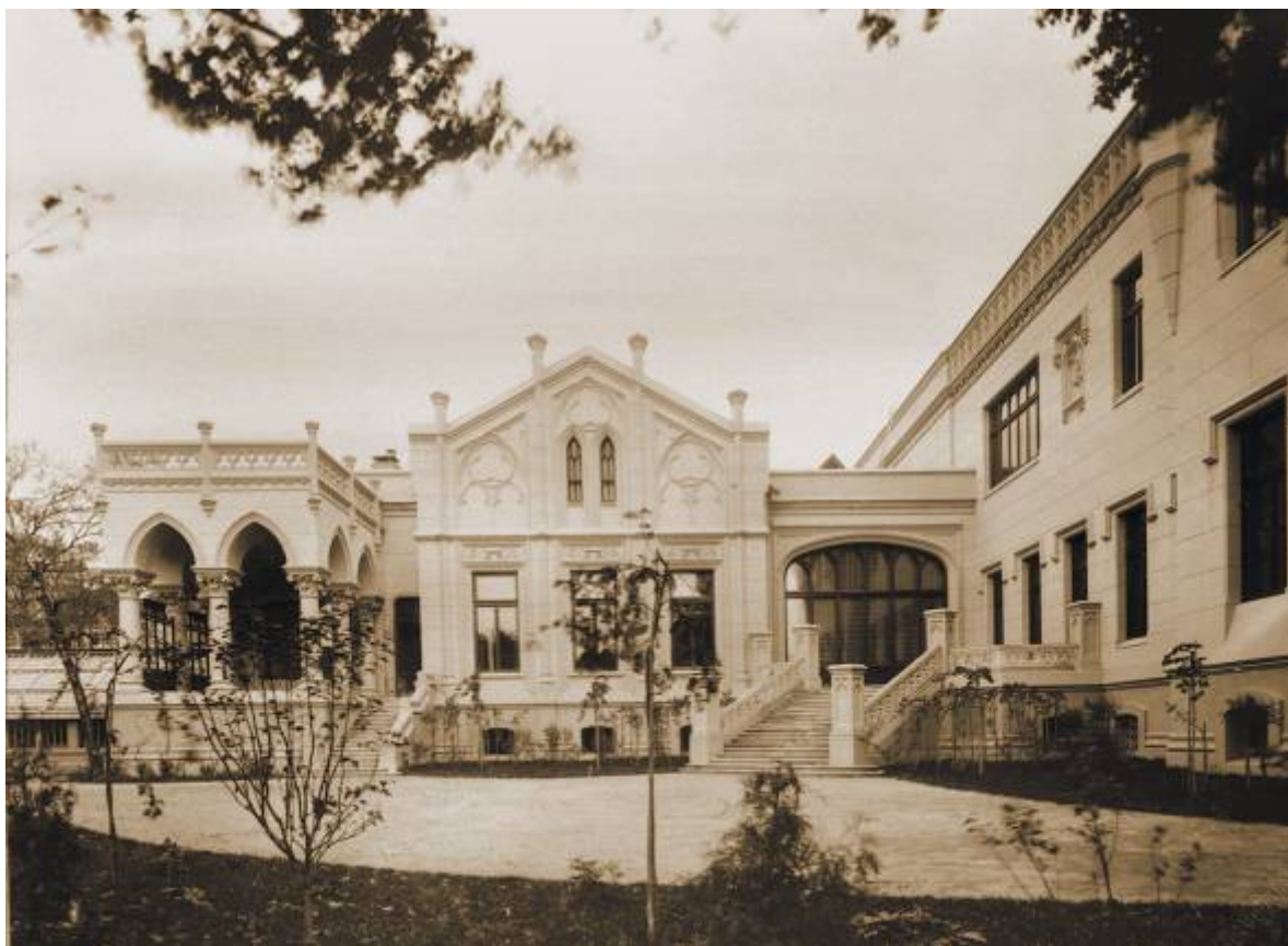
Дом Морозовых на Спиридоновке. Вид внутреннего дворика. Фото 1902 года

отправились на знаменитую Всероссийскую промышленную и художественную выставку 1896 года в Нижнем Новгороде. В это время Савва Тимофеевич Морозов был председателем Нижегородского ярмарочного комитета.