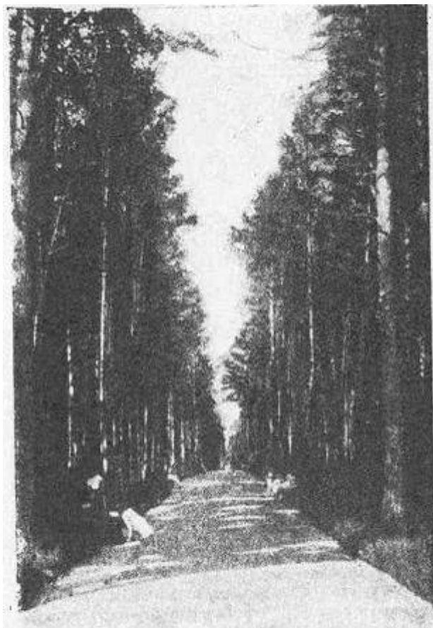
Аллея хвойного леса в Лосиноостровской. Фото 1925 года

Местность вдоль стародавнего пути богомольцев из Москвы в Троице-Сергиеву Лавру всегда была живописна. Пропитанные смоляным воздухом густые хвойные леса являют собой основную растительность бассейнов рек Яузы и Клязьмы. В этих чащобах водилось много зверья, еще в середине 1920-х годов было обилие белок, зайцев и волков, изредка встречались лисицы, барсуки, выдры, выхухоли, куницы, рыси, лоси, даже медведи. Чуть раньше исчез горностаи 1 .