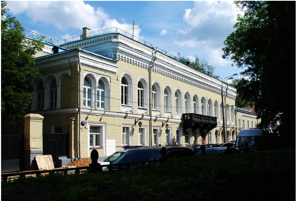
Гоголевский бульвар, дом 14. Современный вид

Во дворе были служебные помещения – кухня, дом для прислуги, гараж, прачечная, собственная электростанция. Вся площадь участка составляла 3782 кв. метра, был тут и небольшой фруктовый сад, занимавший 300 кв. метров внутри усадебной территории.