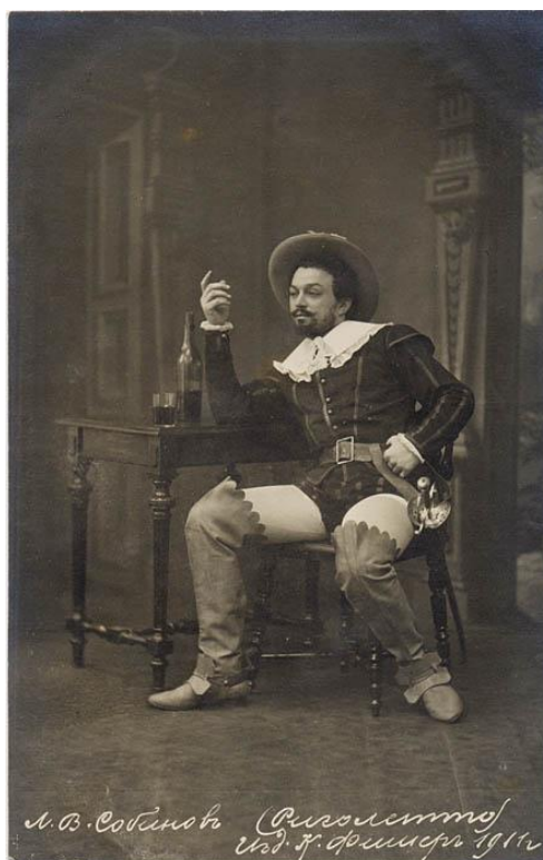
Оперная звезда Леонид Собинов

В доме на Гоголевском бульваре регулярно проходили музыкальные вечера, устраиваемые гостеприимными хозяевами. На них бывали такие выдающиеся композиторы, как С.В. Рахманинов, А.К. Глазунов, Н.К. Метнер, не раз выступали здесь певцы Ф.И. Шаляпин и Л.В. Собинов.