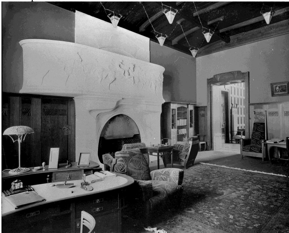
Особняк в Штатном переулке. Интерьер кабинета

Размеры холла колоссальны, он покоряет красотой и соразмерностью пространства. С потолка на тонких металлических нитях спускаются напоминающие жемчужины светильники. Монументальной «приподнятости» пространства соответствуют высокие резные панели, строгая мебель и рельефы, изображающие мужскую и женскую фигуры, которые поддерживают верхнюю часть камина.