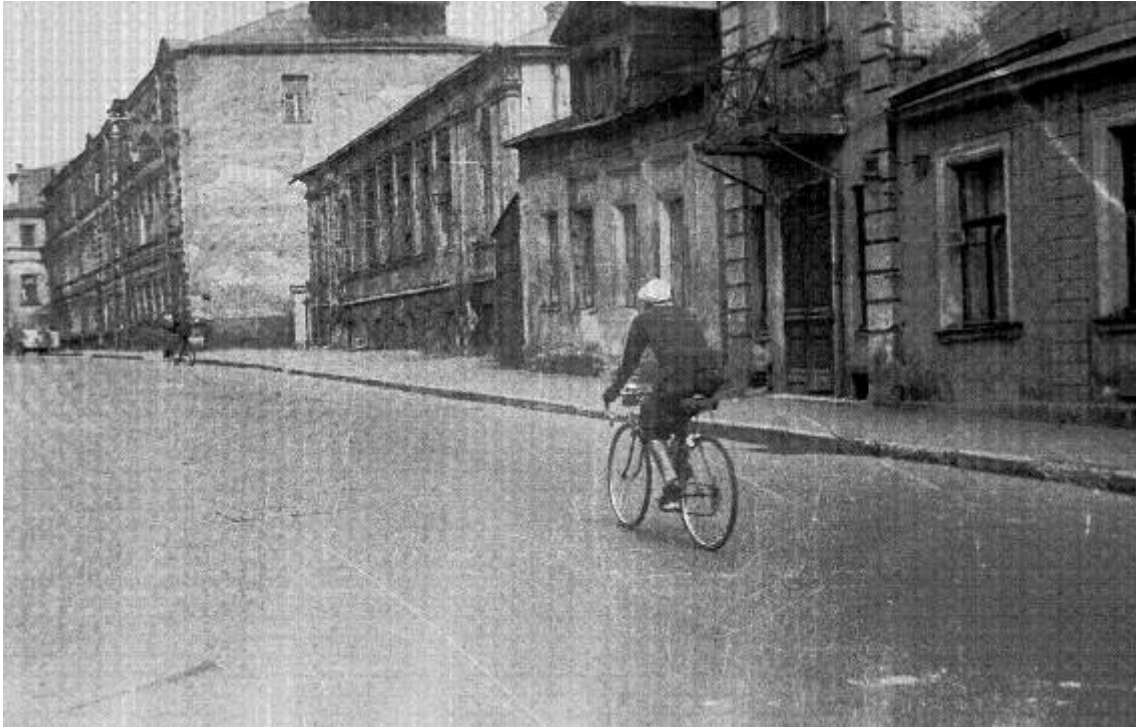
Арбат. Большой Афанасьевский переулок в 1950-е годы.

По данным описи домовладения, сделанной в 1914 году в жилом подвале пять комнат площадью 20–25 кв. м. сдавались внаем пяти жильцам за 120 рублей в год. На первом этаже квартира из семи комнат (14 окон) площадью около 204 кв. м. сдавалась за 1200 рублей в год. На втором этаже в такой же квартире жила домовладелица Терновская. Квартира на третьем этаже также сдавалась за 1200 рублей в год.